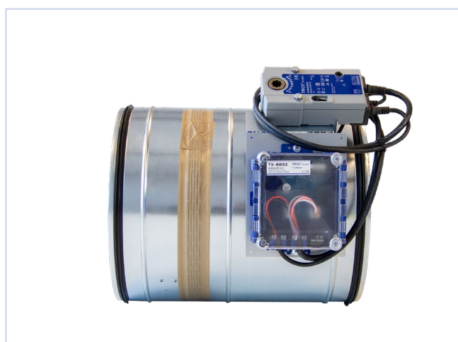
Fig.2, Brannspjeld påmontert ZX03- Aurasafe-mini