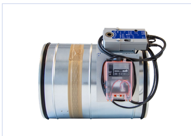
Fig.3, Brannspjeld påmontert ZX04/ZX05- Belimo BKN/MOD