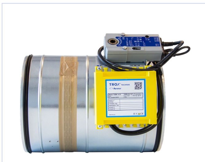
Fig.1, Brannspjeld påmontert ZX01/ZX02- Aurasafe

Eksempler på FKRS/FKR med påmontert spjeldmodul kan du se nedenfor: