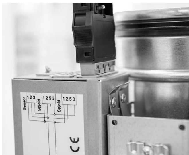
VAV SRC KIT